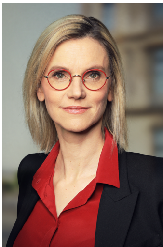
Agnès Pannier-Runacher, ministre de la Transition énergétique